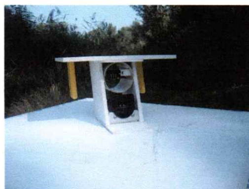
Exemple planchette de navigation