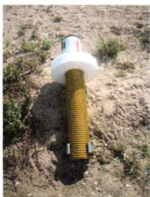
Exemple Bouée repère